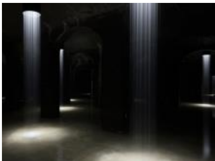
Ingvar Cronhammar: H, 2015.

Der er tre hovedkomponenter i Ingvar Cronhammars "forestilling": Vandet, lyset og rummet, som er begroet med stalakitter, der vokser ud af granitvæggene og danner en ny, organisk "hud". Publikum ledes rundt i et loop. Det er en fascinerende "rejse" gennem værket. Hvis man stiller sig sådan, at man kigger gennem flere rum, fremstår vandsøjlerne helt metafysiske – som slør, der gemmer sig bag slør. Det er mageløst.